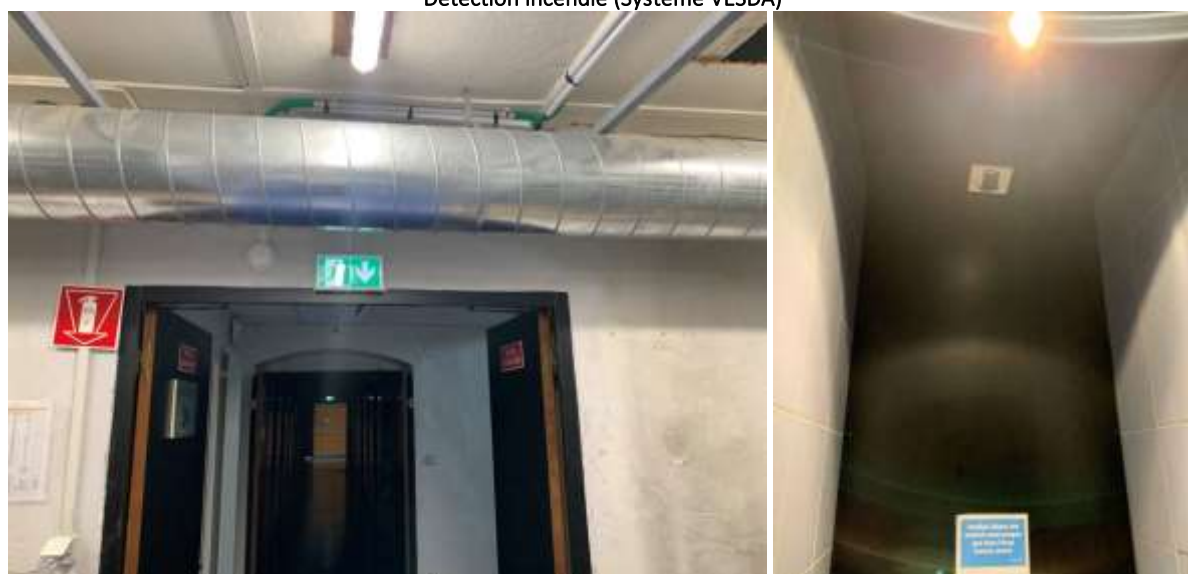
Gaine de ventilation / Bouche d'extraction