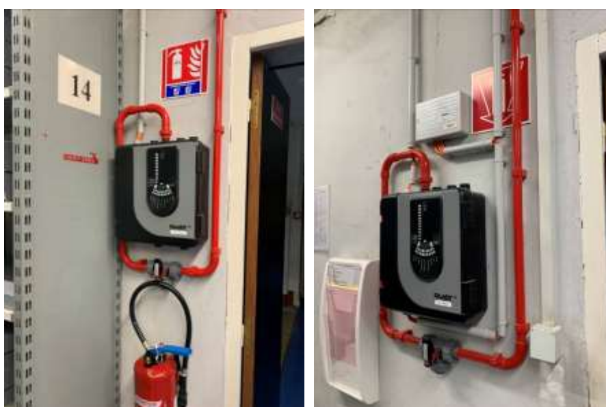
Détection incendie (Système VESDA)